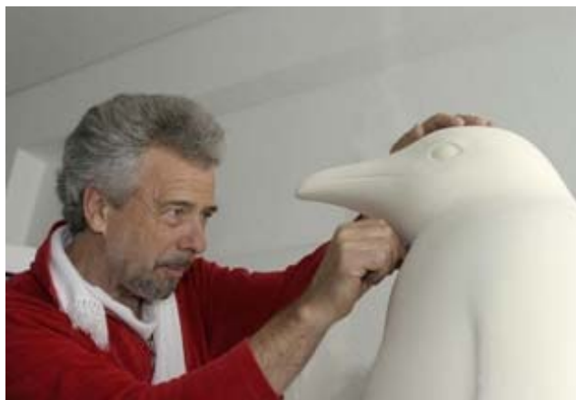
Im Atelier von Lando nahmen die beiden erst ein Bad, um schön weiss zu sein.

Aber jetzt müssen wir los ins Atelier und euch herrichten. Sonst wird das kein Meisterwerk. Los! Kommt schon.“ Lando verliess seine Wohnung und machte sich auf den Weg zu seinem Atelier. Isidor und Pingo watschelten ihm brav hinterher. Es war ein Bild für die Götter.